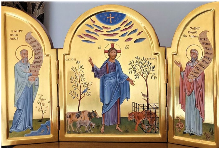
CHRIST BREAKING THE BONDS OF ANIMAL SUFFERING – Pan-Orthodox Concern for Animals